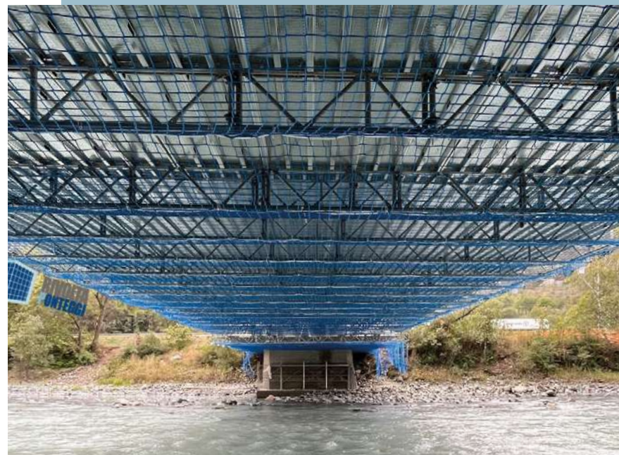
Pont sur le Sesia, Quarona (VC)

Les échafaudages pour ponts et viaducs sont conçus pour répondre aux exigences spécifiques de ces structures. Ils offrent des plateformes robustes et stables, indispensables pour l'inspection, l'entretien, la réparation ou la construction, tout en garantissant sécurisé aux zones difficiles d'accès. Nos solutions se distinguent par leur flexibilité et leur adaptabilité à tout type de surface et besoin. Nous proposons des solutions sur mesure et de haute qualité, appuyées par des années d'expérience. Faites confiance à notre expertise pour obtenir des échafaudages sûrs, solides et conformes aux normes de sécurité les plus strictes, assurant des résultats excellents et une tranquillité d'esprit pendant les travaux.