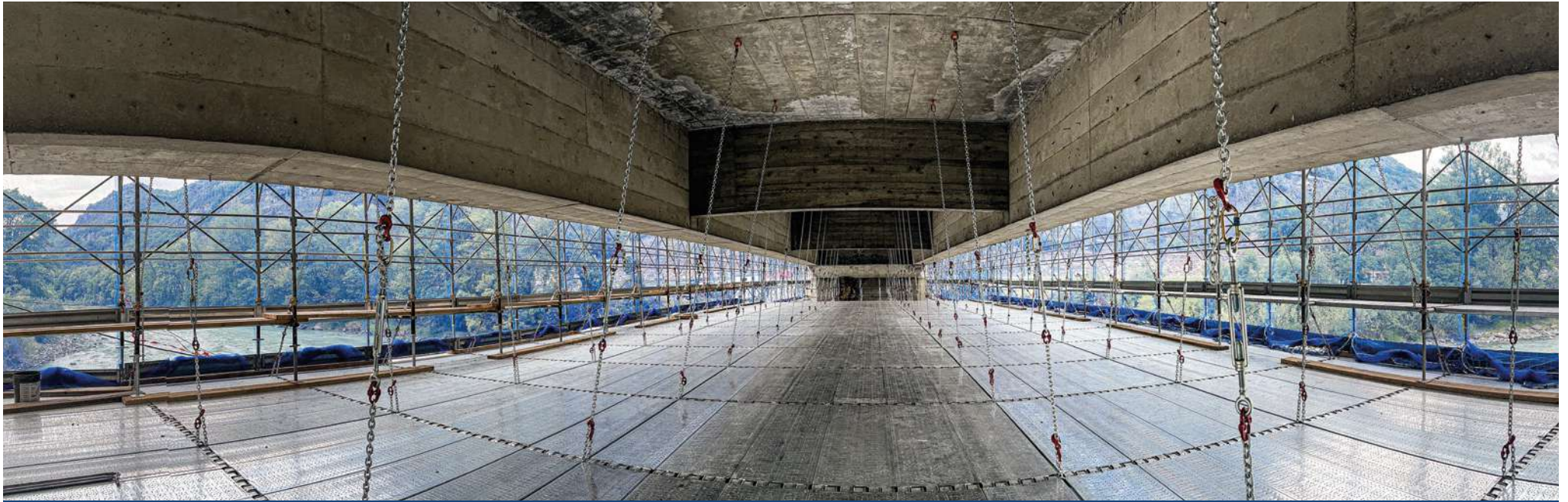
S.R.10, Pontey (AO)