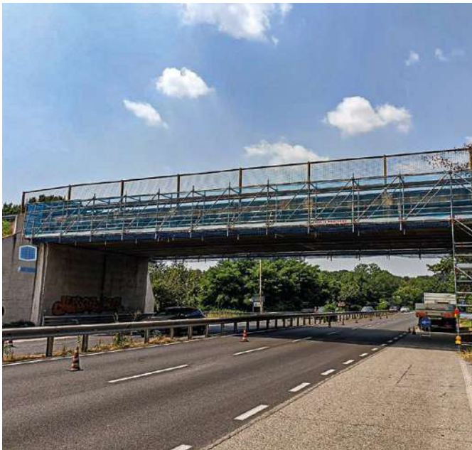
Agrate Brianza (MB)