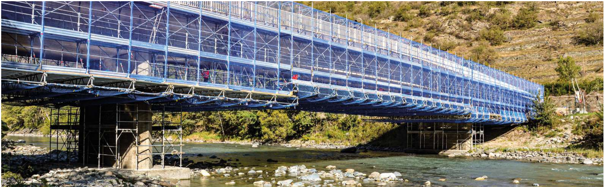
Chantier SR 15, Brissogne (AO)