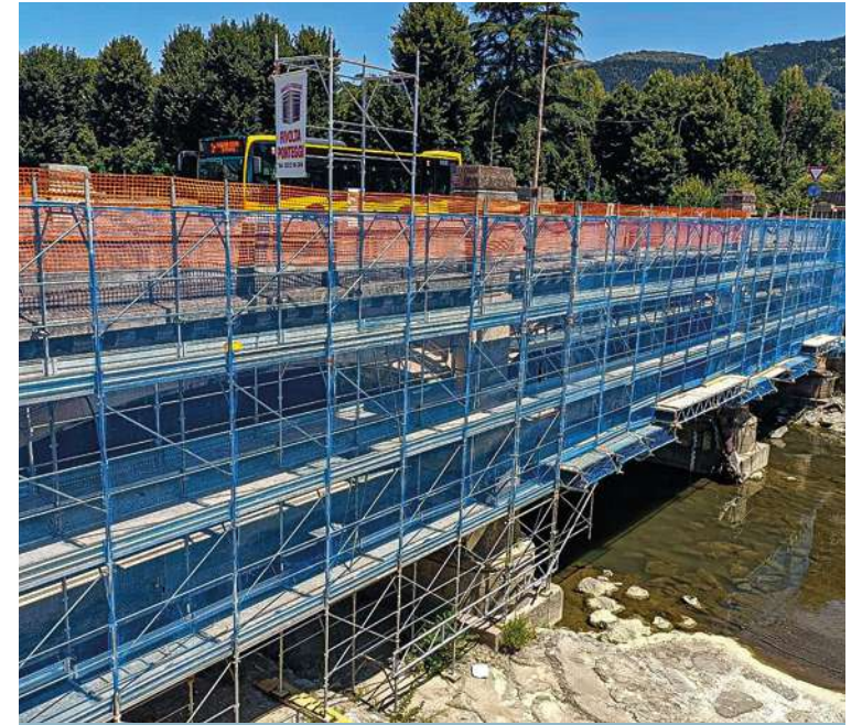
Pont de la Victoire, Prato