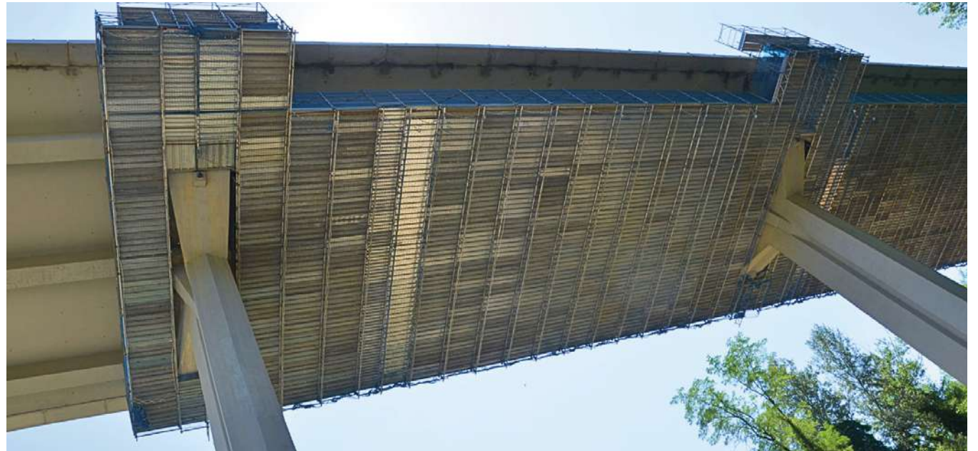
San Casciano, Val di Pesa (FI) RA 3