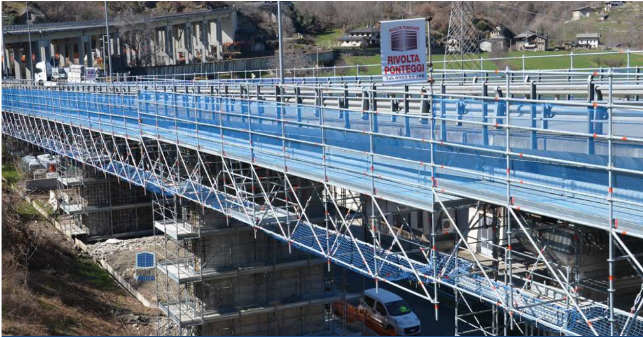
Aymavilles, Vallée d'Aoste